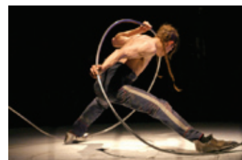
Secret (temps 1 et 2)